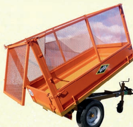
GV 20 BR avec réhausses grillagées