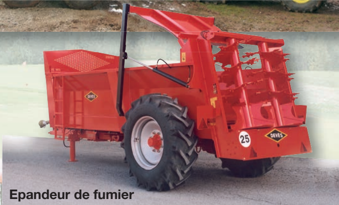
Epandeur de fumier

Toutes nos remorques sont conformes au Code de la Route. NORME CE