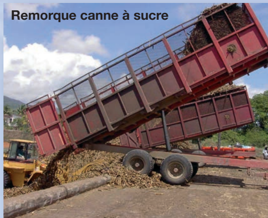
Remorque canne à sucre