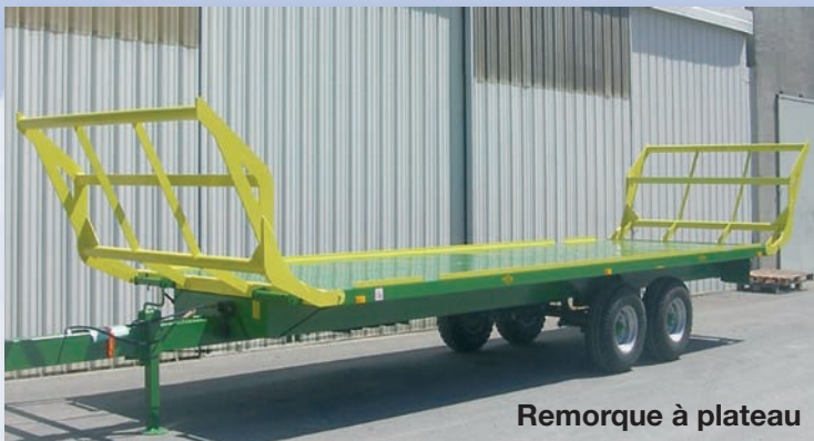
Remorque à plateau