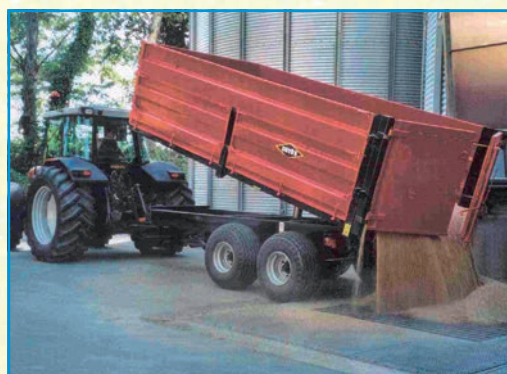
GV 100 BRB