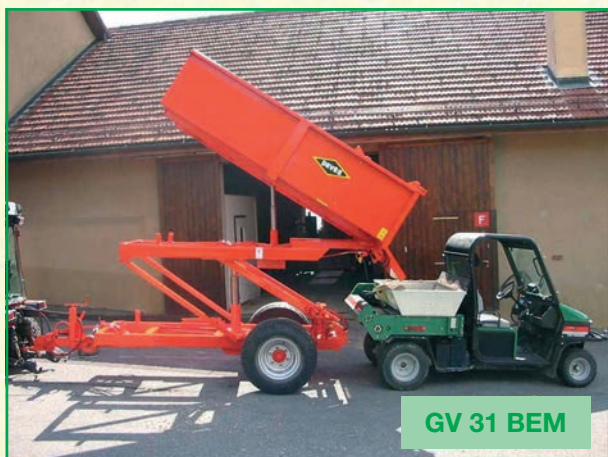
GV 31 BEM