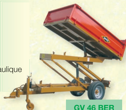
GV 46 BER