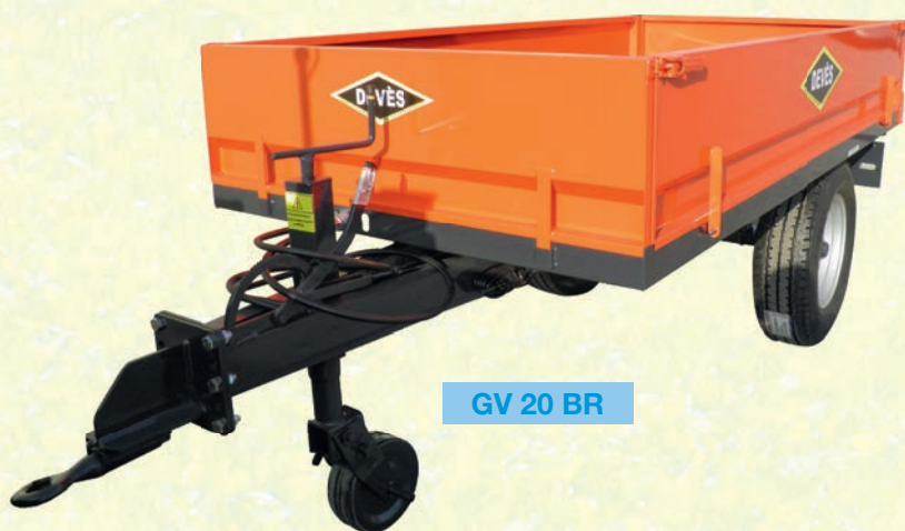
GV 20 BR