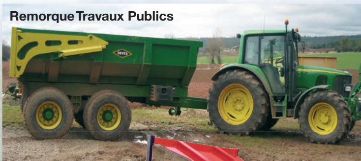
Remorque Travaux Publics