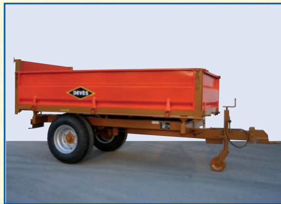
GV 31 TRI