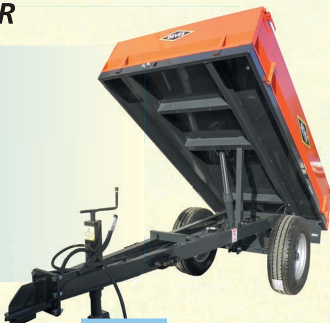
GV 20 BR