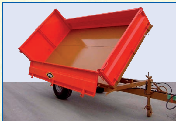
GV 46 TRI