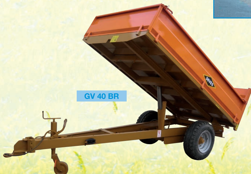
GV 40 BR