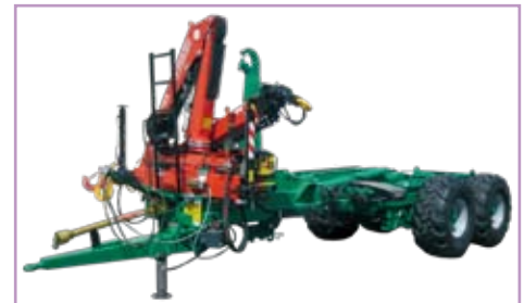
AC 150 AVEC GRUE