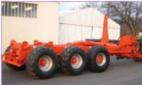
AC 240 PONT MOTEUR